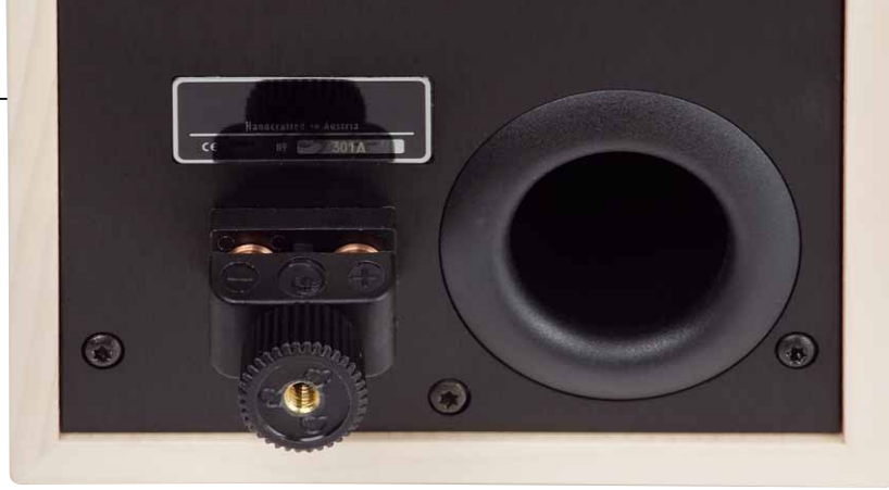
Außergewöhnlich: das massive Kupfer-Anschlussterminal mit zentraler Drehschraube. Strömungsgünstig: das große Reflexrohr

Die Art ist ein anspruchsvoller Lautsprecher. Sie wird umso besser, je hochwertiger die vorgeschaltete Elektronik ist. Das mag sich selbstverständlich anhören, ist es aber keineswegs: Viele Lautsprecher mit ausgeprägten Eigenarten neigen dazu, die Eigenheiten der Kette zu maskieren. Die Trenner & Friedl braucht eine lebendige, agile Ansteuerung, sonst klingt sie schnell langweilig. Was zum Beispiel exzellent funktioniert, ist der kleine 47 Laboratory-Vollverstärker „4717“, den wir Ihnen an anderer Stelle in Verbindung mit einem hauseigenen Lautsprecher vorstellen. Röhren sind so recht nicht ihr Ding, wer's trotzdem probieren will, sollte ins Regal mit ein paar Watt mehr greifen.