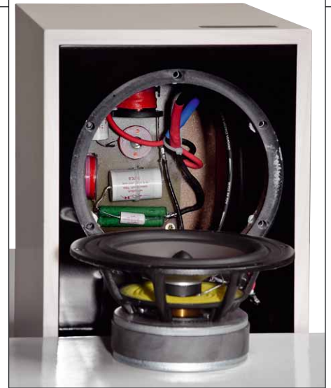
Die bestens bestückte Frequenzweiche sitzt im Gehäuse hinter dem exzellenten Alumembran-Woofer

Akustisch zählt die Art auf gar keinen Fall zu den Lautsprechern mit ausgeprägtem „Hoppla, jetzt komm ich“-Charakter. Sie spielt beim ersten Hinhören im besten Sinne unauffällig. Der Eindruck ist allerdings nicht von Bestand. Es braucht ein paar Minuten, um zu entdecken, was hier Besonderes vor sich geht. Dazu gehörender Lieblingshörplatz, die richtige Musik und eine gelassene Erwartungshaltung. Die kleine Trenner & Friedl sammelt ihre Punkte ganz sanft, aber reich- und nachhaltig. Zunächst erst einmal befließigt sich die Box einer gewissen Zurückhaltung im Bassbereich. Wir haben es hier nämlich mal nicht mit einer Abstimmung zu tun, die Bass durch einen angehobenen Grundtonbereich suggeriert. Die Kleine läuft gerade, und wenn sie nicht mehr kann, dann kommt halt nix mehr. Das ist völlig in Ordnung, hat sogar ein paar handfeste Vorteile, und die betreffen die mittleren Lagen, die ohne irgendwelche Verdeckungseffekte einfach mehr zeigen dürfen. Ich darf den Konstrukteuren ein großes Kompliment dafür aussprechen, wie sie die nicht ganz einfach zu beherrschende Membran des Tiefmitteltöners zum „Singen“ bekommen haben: Keinerlei metallischer Beigeschmack, kein betont „krispes“ Klangbild, aber trotzdem sehr fein aufgelöste Gesangsstimmen. Auch der Hochtöner wirkt eher sanft und ein bisschen dezent, aber die Rechnung geht auf: Der kritische Brillanzbereich tönt überaus stimmig, so dass