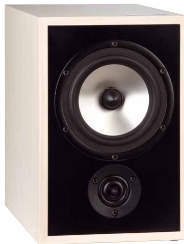
Mit schlichter Eleganz zum Erfolg: Die äußerst stimmige Farbkombination, knackige Proportionen und hübsche Details machen die Trenner & Friedl zu einem attraktiven Schallwandler